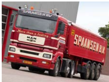
Spaansen verzorgt de logistiek