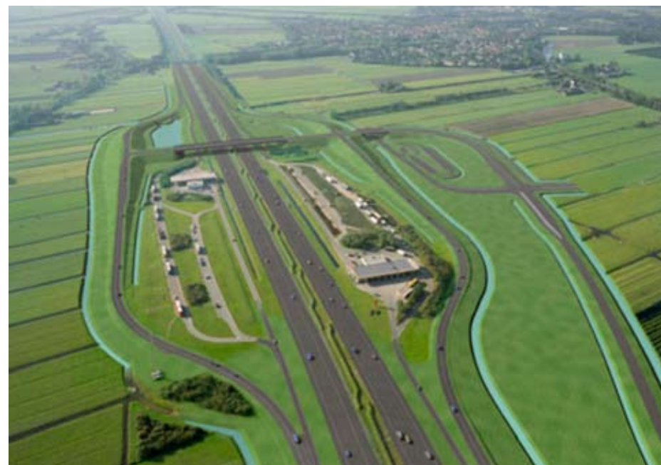
Aansluiting A12 Woerden-Oost